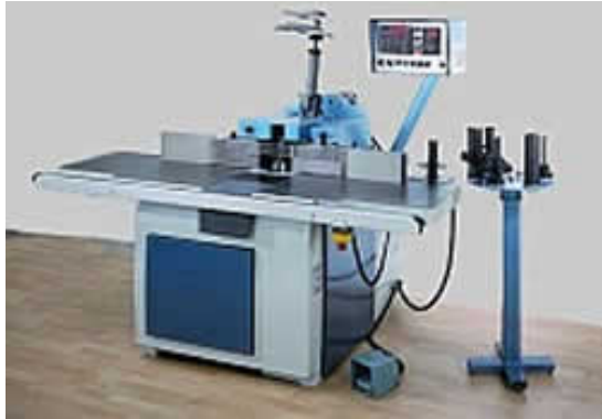
Bild mit Fräsdorn HSK F80 mit hydraulischer Lösung und beidseitiger Tischplattenverlängerung, sind optional und somit im Aktionspreis nicht enthalten.